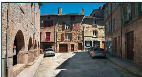
Etat existant de la place de l'ancienne Mairie

Ce chantier portera à la fois sur la réfection des trottoirs et de la voirie. Il permettra de redonner à cette place son caractère et ses usages et de valoriser les bâtiments alentours. Cette opération bénéficie de subventions du Conseil général, de l'Etat et du Conseil régional.