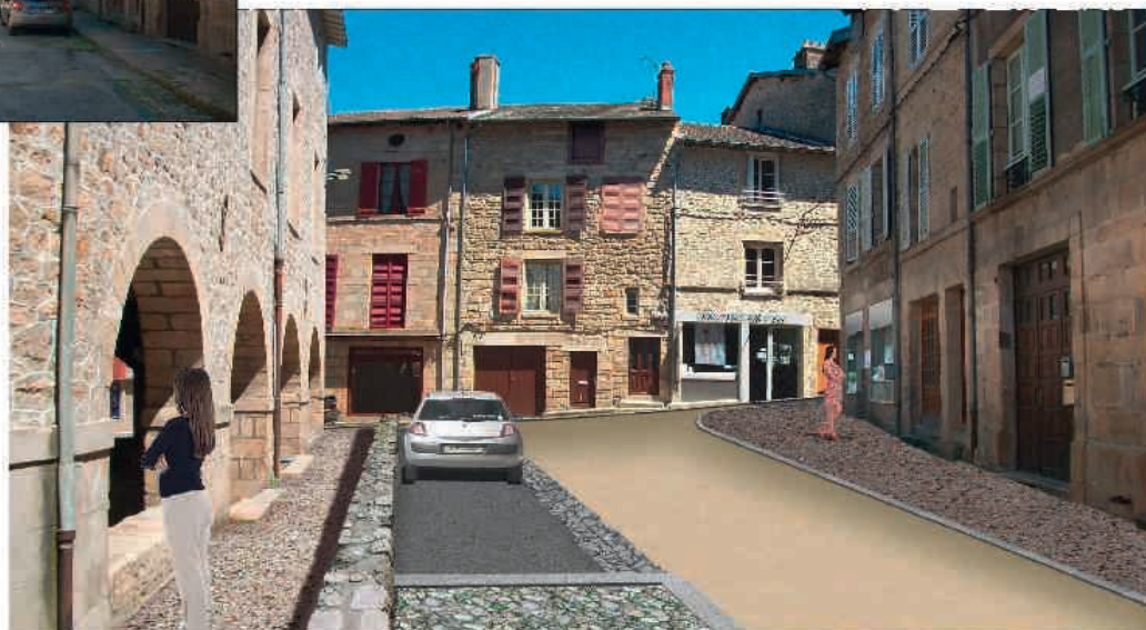
Perspective du projet d'aménagements de la place de l'ancienne Mairie